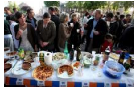
Fête des voisins