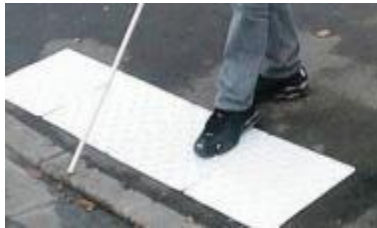
sol en relief signalant route

Mieux vivre c'est aussi vivre ensemble. Il faut faciliter le quotidien de tous et notamment des personnes handicapées en proposant des aménagements (trottoirs abaissés, feux tricolores sonorisés, rampes d'accès...).