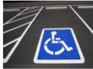
place de parking aménagée